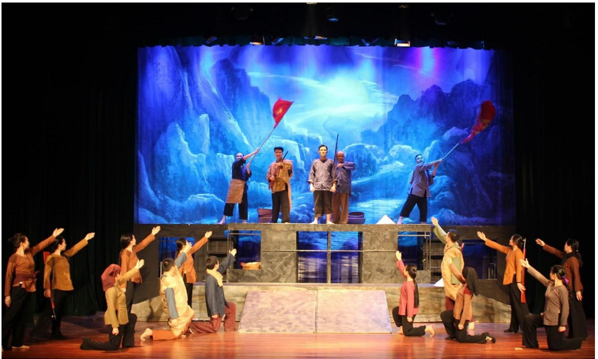
Ảnh 20: Cảnh trong vở Nguyễn Văn Cừ - Tuổi trẻ chí lớn. Công trình chào mừng Kỷ niệm 110 năm ngày sinh Tổng Bí thư Nguyễn Văn Cừ.