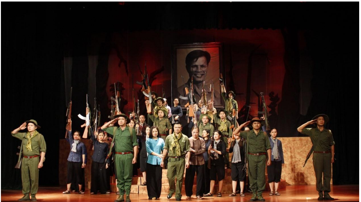
Ảnh 08: Cảnh trong vở Nguyễn Chí Thanh - Sáng trong như ngọc một con người . HCV Hội diễn Nghệ thuật chuyên nghiệp toàn quân năm 2014.