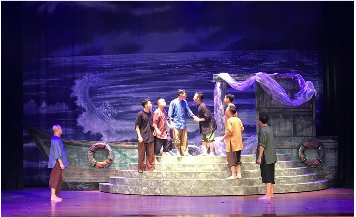
Ảnh 19: Cảnh trong vở Biển vẫn con đường mòn . Vở diễn chào mừng kỷ niệm 60 năm Ngày mở đường Hồ Chí Minh trên biển, năm 2021.