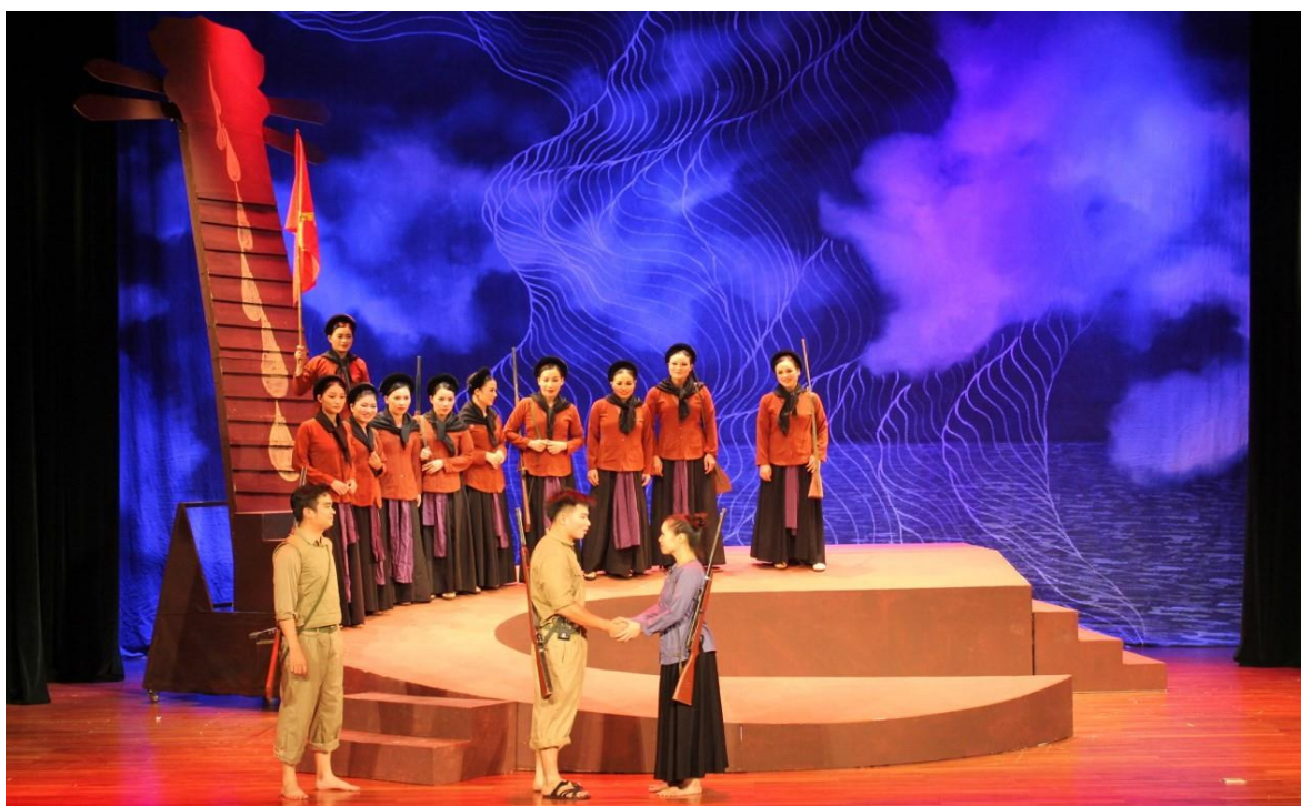
Ảnh 16: Cảnh trong vở Câu Kiều ru một đời người . Tham gia Liên hoan sân khấu quốc tế thử nghiệm lần thứ IV năm 2019.