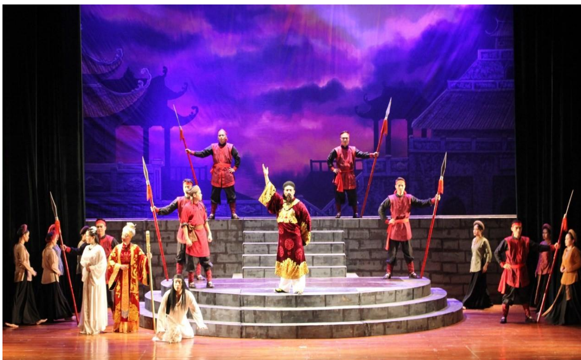
Ảnh 15: Cảnh trong vở Công lý không gục ngã . HCV Liên hoan nghệ thuật Chèo toàn quốc năm 2019.