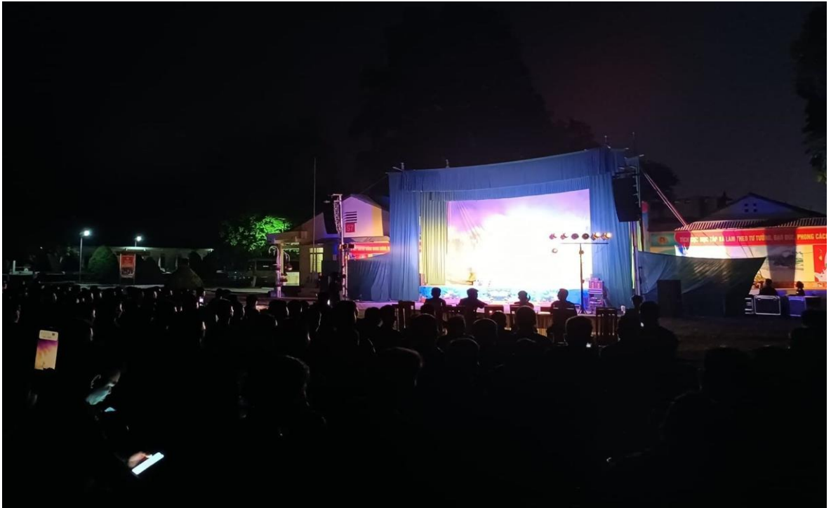
Ảnh 23: Cán bộ và chiến sĩ Trung đoàn 754, Bộ chỉ huy quân sự Tỉnh Sơn La đón xem chương trình biểu diễn của Nhà hát Chèo Quân đội, năm 2024.