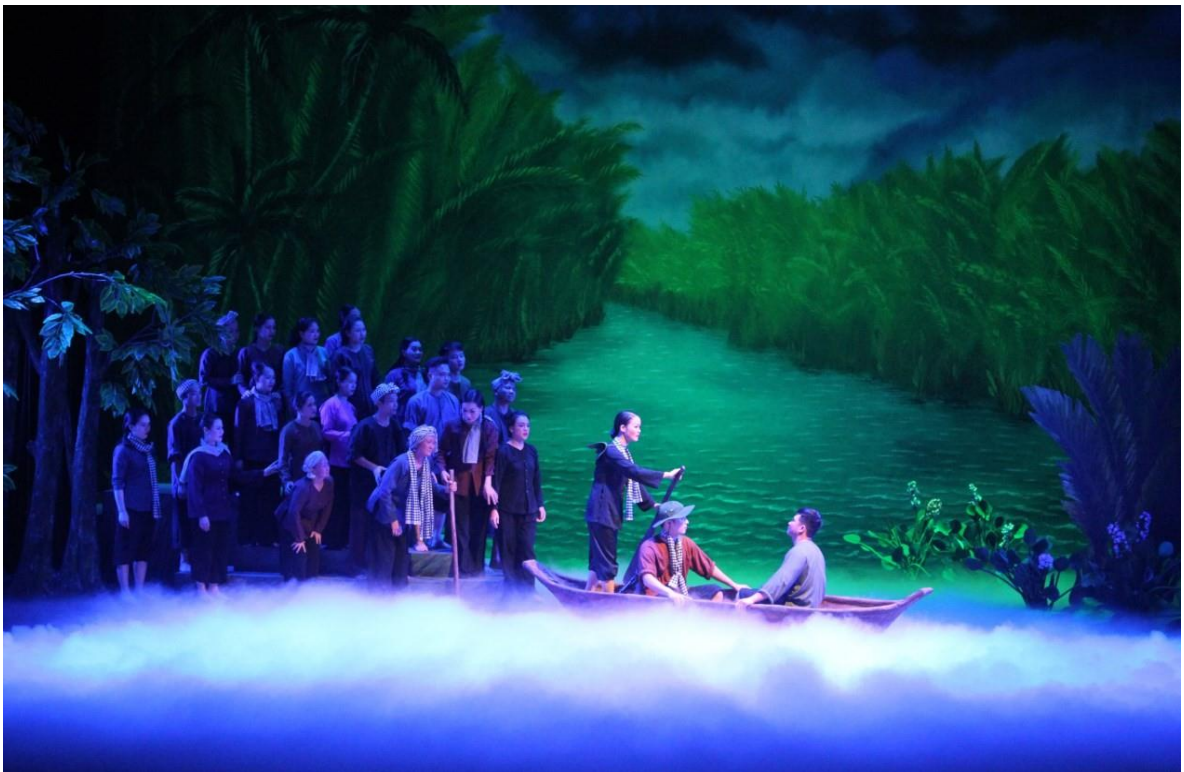
Ảnh 12: Cảnh trong vở Rặng trâm bầu . Giải Xuất sắc về đề tài LLVT và chiến tranh cách mạng tại Hội diễn Nghệ thuật chuyên nghiệp toàn quân năm 2018.