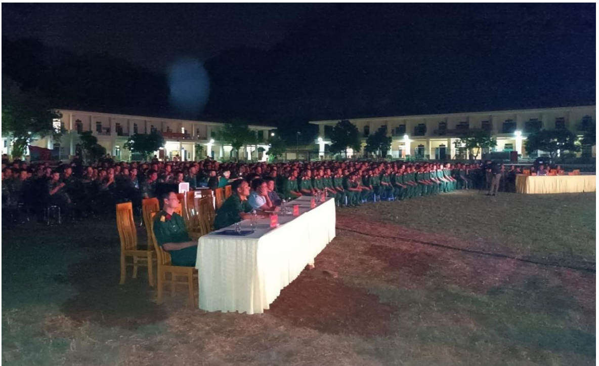
Ảnh 24: Cán bộ và chiến sĩ Trung đoàn 754, Bộ chỉ huy quân sự Tỉnh Sơn La đón xem chương trình biểu diễn của Nhà hát Chèo Quân đội, năm 2024.