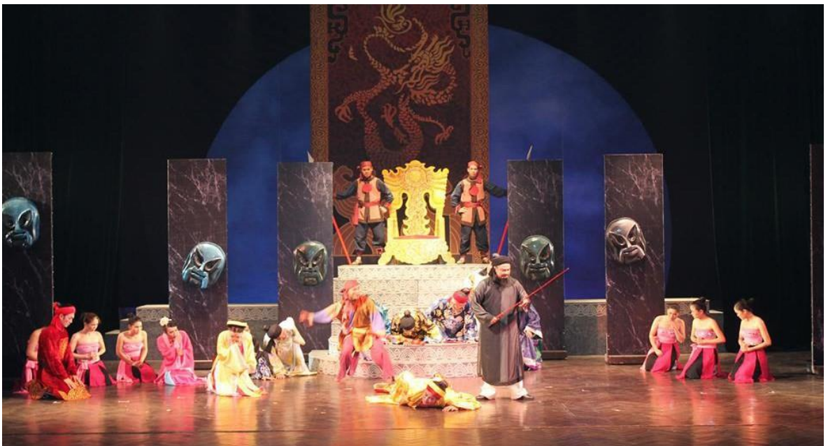
Ảnh 06: Cảnh trong vở Chu Văn An - Người thầy của muôn đời . HCV Hội diễn sân khấu Chèo chuyên nghiệp toàn quốc năm 2013; Giải thưởng Văn học nghệ thuật năm 2013 do Ủy ban toàn quốc Liên hiệp các Hội Văn học nghệ thuật Việt Nam trao tặng.