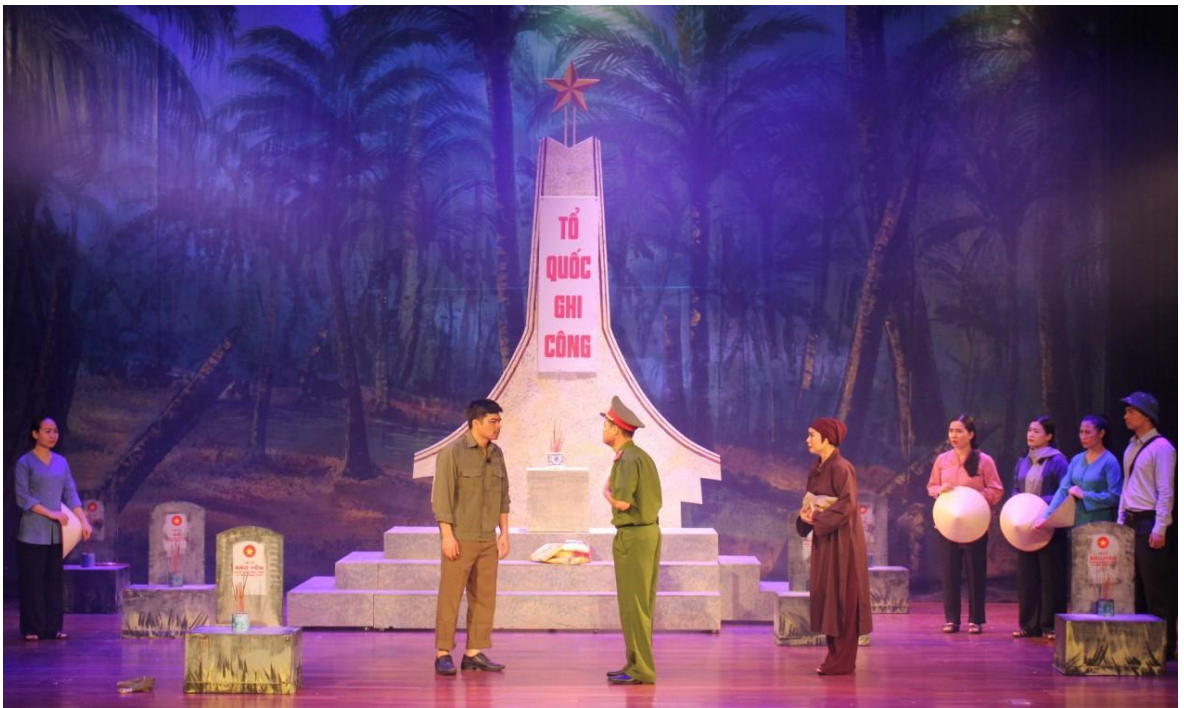
Ảnh 18: Cảnh trong vở Ngày trở về . Huy chương Vàng trong Liên hoan sân khấu toàn quốc về “Hình tượng người chiến sĩ Công an nhân dân” lần thứ IV năm 2020.