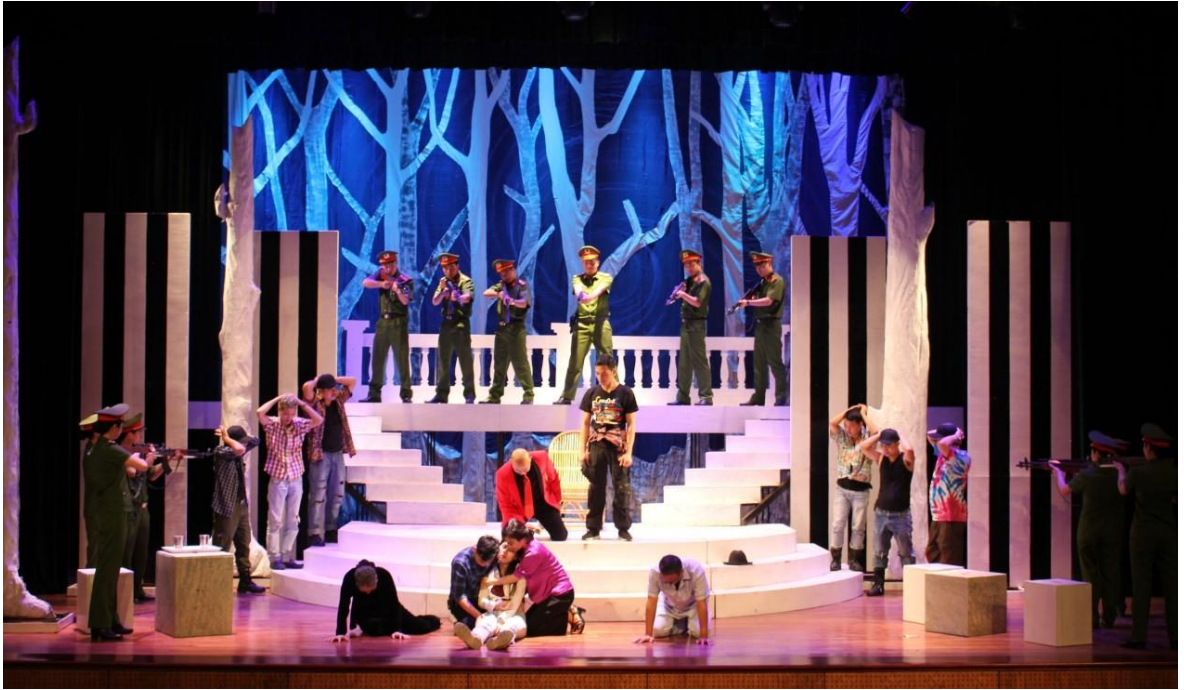
Ảnh 17: Cảnh trong vở Hai mươi năm thù hận . Vở diễn tham gia Liên hoan sân khấu toàn quốc về “Hình tượng người chiến sĩ Công an nhân dân” lần thứ IV năm 2020.