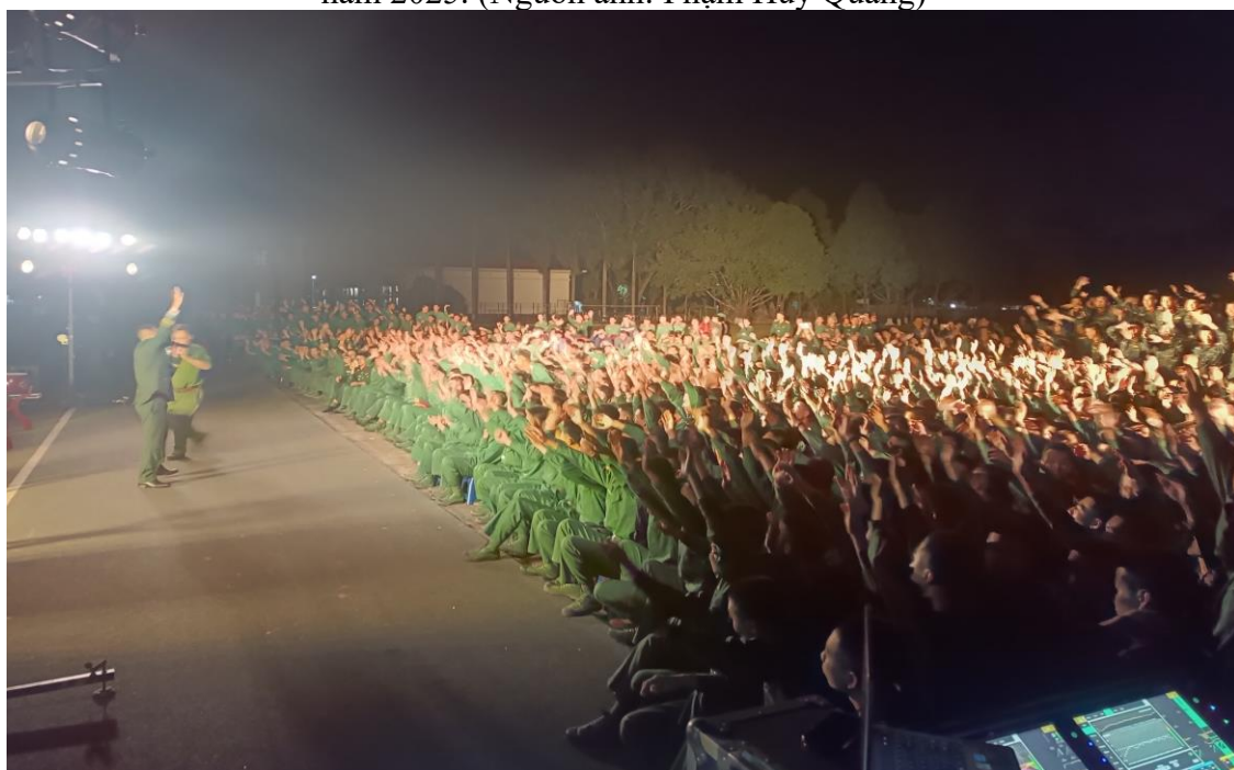
Ảnh 28: Cán bộ và chiến sĩ Trung đoàn 102, Sư đoàn 308, Quân đoàn 12 đón xem chương trình biểu diễn của Nhà hát Chèo Quân đội, năm 2025.