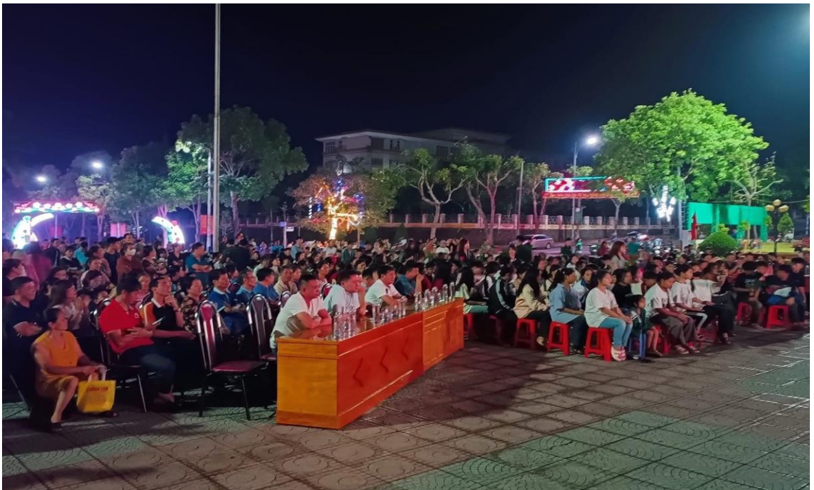
Ảnh 22: Đồng bào các dân tộc Huyện Phong Thổ, Tỉnh Lai Châu đón xem chương trình biểu diễn của Nhà hát Chèo Quân đội, năm 2024.