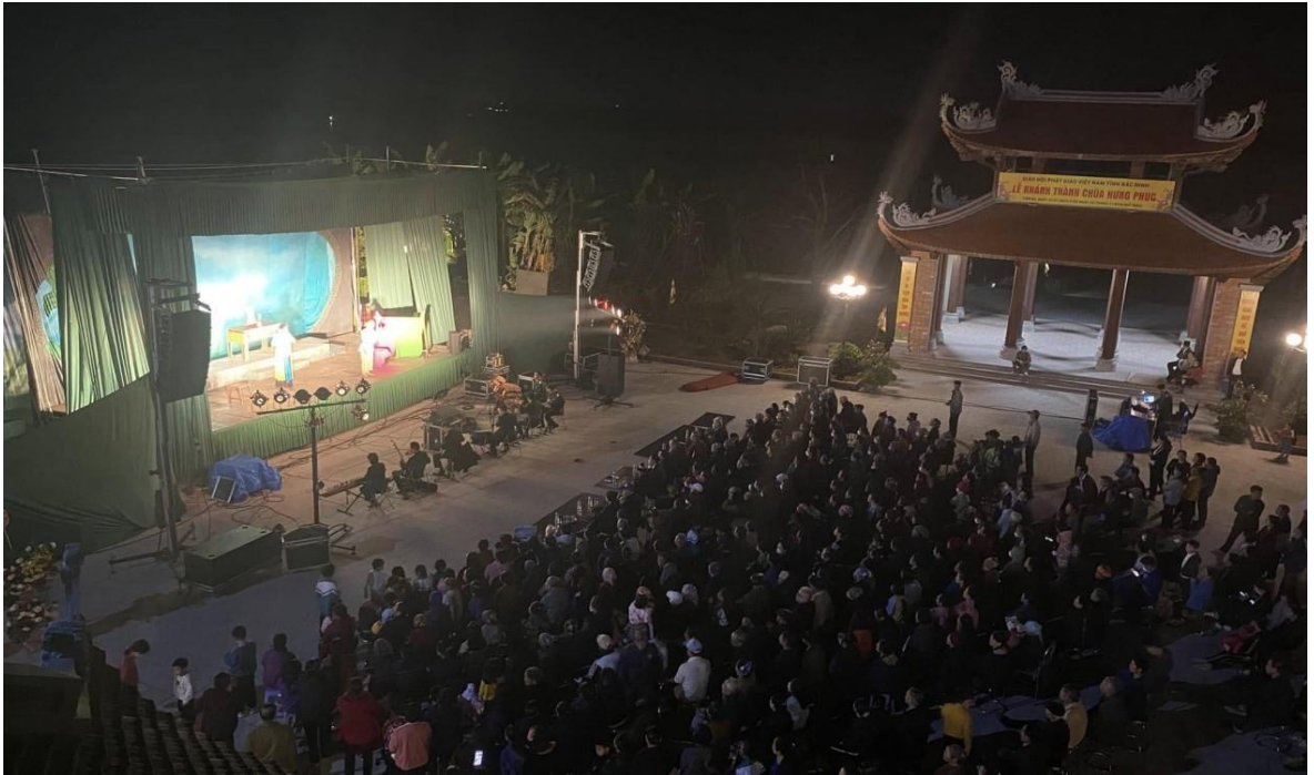
Ảnh 15: Cán bộ và nhân dân xã Cảnh Hưng, huyện Tiên Du, tỉnh Bắc Ninh đón xem chương trình biểu diễn của Nhà hát Chèo Quân đội, năm 2023. (Nguồn ảnh: Trần Văn Đón).