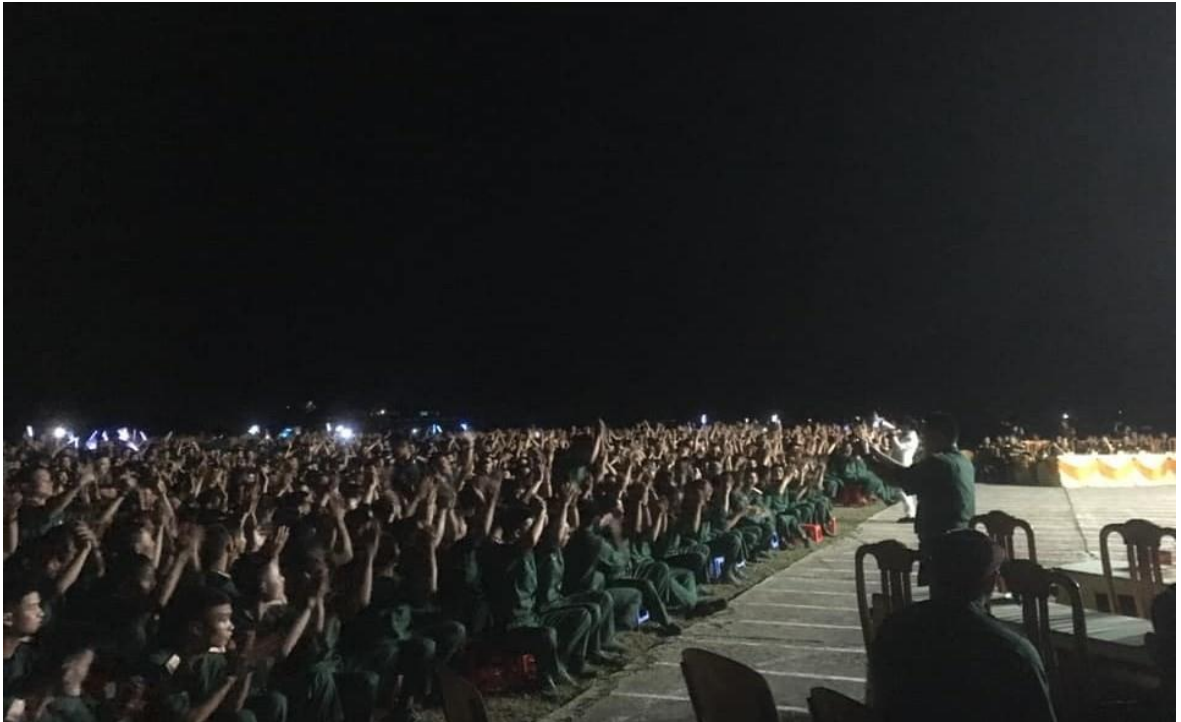
Ảnh 07: Cán bộ, chiến sĩ Sư đoàn 2, Quân khu 5, đón xem chương trình biểu diễn của Nhà hát Chèo Quân đội, năm 2022.