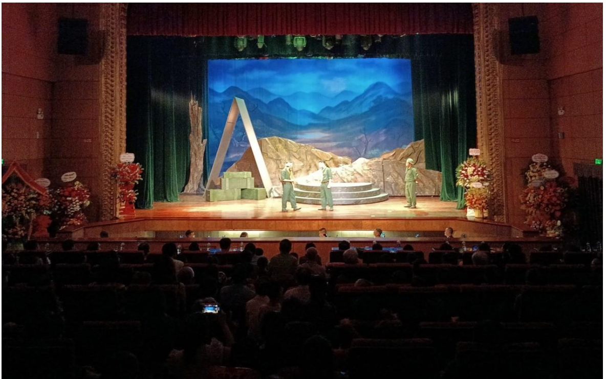
Ảnh 14: Khán giả đón xem chương trình công diễn của Nhà hát Chèo Quân đội tại rạp của Nhà hát, năm 2023.