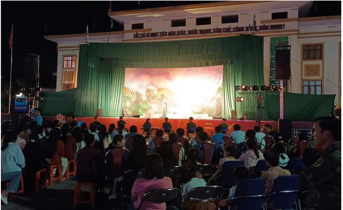
Ảnh 21: Đồng bào các dân tộc Huyện Phong Thổ, Tỉnh Lai Châu đón xem chương trình biểu diễn của Nhà hát Chèo Quân đội, năm 2024.