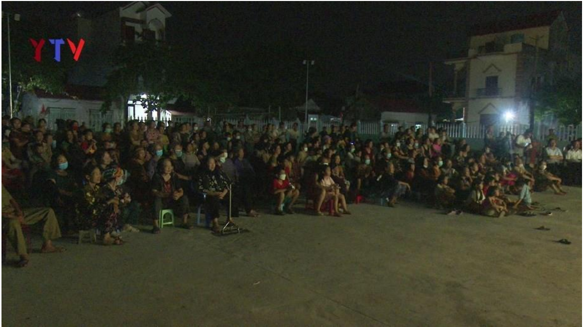
Ảnh 09: Cán bộ và nhân dân huyện Yên Dũng, tỉnh Bắc Giang, đón xem chương trình biểu diễn của Nhà hát Chèo Quân đội, năm 2022.