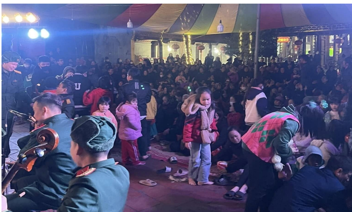
Ảnh 06: Cán bộ và nhân dân phường Đồng Ky, Tp. Từ Sơn, tỉnh Bắc Ninh đón xem chương trình biểu diễn của Nhà hát Chèo Quân đội, năm 2020.