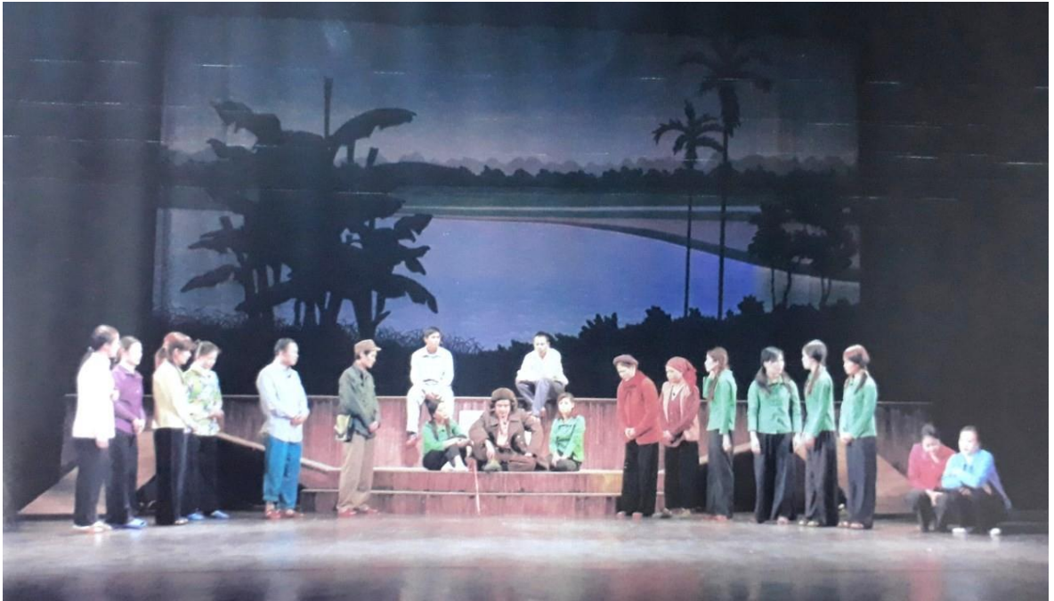
Ảnh 05: Cảnh trong vở Bến nước đời người . HCB Liên hoan các vở Chèo đề tài hiện đại năm 2011.