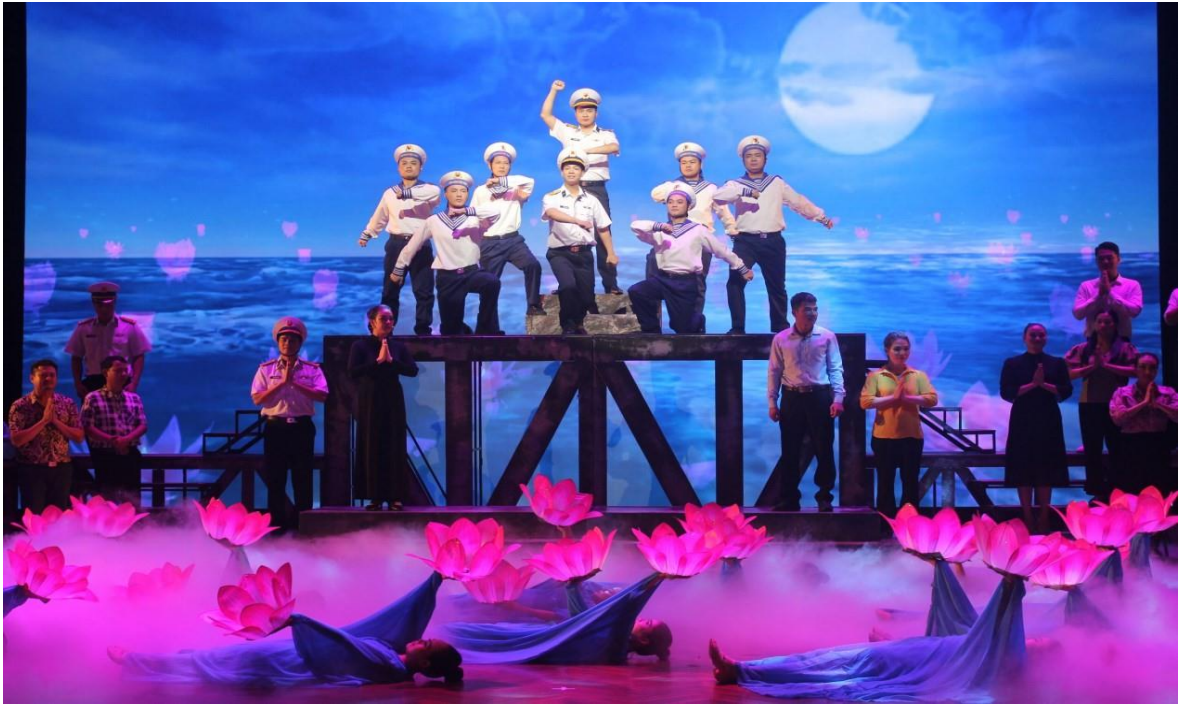
Ảnh 23: Cảnh trong vở Đất liền và biển cả . Huy chương vàng Hội diễn nghệ thuật chuyên nghiệp về đề tài quốc phòng toàn dân năm 2023.