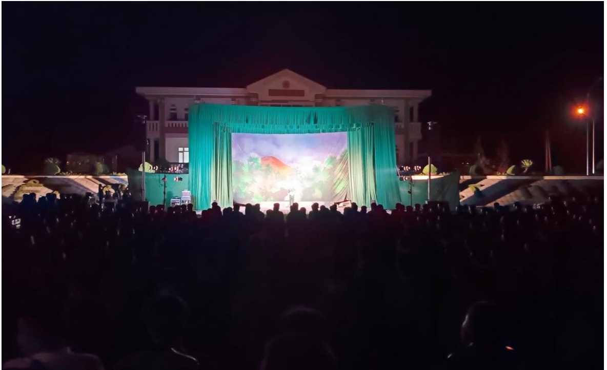
Ảnh 25: Cán bộ và chiến sĩ Trung đoàn 880, Bộ Chỉ huy quân sự tỉnh Lai Châu đón xem chương trình biểu diễn của Nhà hát Chèo Quân đội, năm 2024.