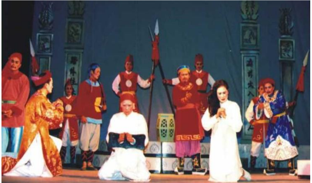
Ảnh 01: Cảnh trong vở Nữ tú tài . HCV Hội diễn Nghệ thuật chuyên nghiệp toàn quốc năm 1995.