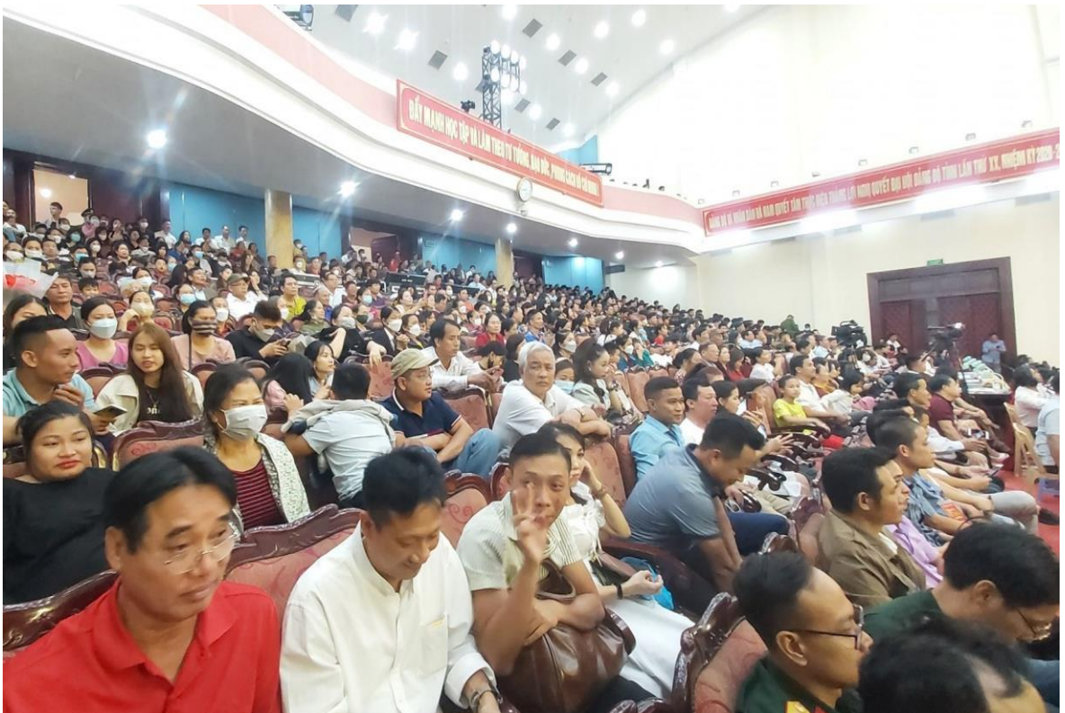
Ảnh 10: Khán giả đón xem vở diễn tham gia Liên hoan Sân khấu Chèo chuyên nghiệp toàn quốc năm 2022 của Nhà hát Chèo Quân đội tại Hà Nam.