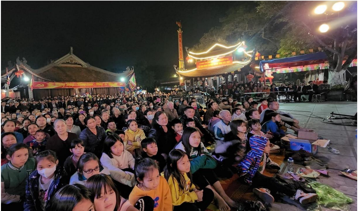
Ảnh 13: Cán bộ và nhân dân phường Đồng Kỳ, Tp. Từ Sơn, tỉnh Bắc Ninh đón xem chương trình biểu diễn của Nhà hát Chèo Quân đội, năm 2023.