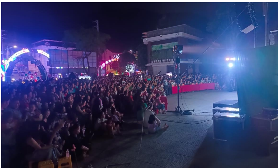
Ảnh 27: Cán bộ và chiến sĩ Ban Chỉ huy Khu vực phòng thủ 1 – Thuận Châu, Bộ Chỉ huy quân sự Tỉnh Sơn La đón xem chương trình biểu diễn của Nhà hát Chèo Quân đội, năm 2025.