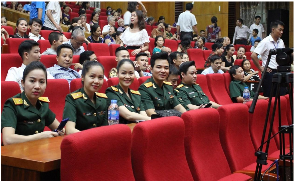
Ảnh 04: Khách giả đón xem vở diễn tham gia Liên hoan chèo toàn quốc năm 2019 của Nhà hát Chèo Quân đội tại Bắc Giang.