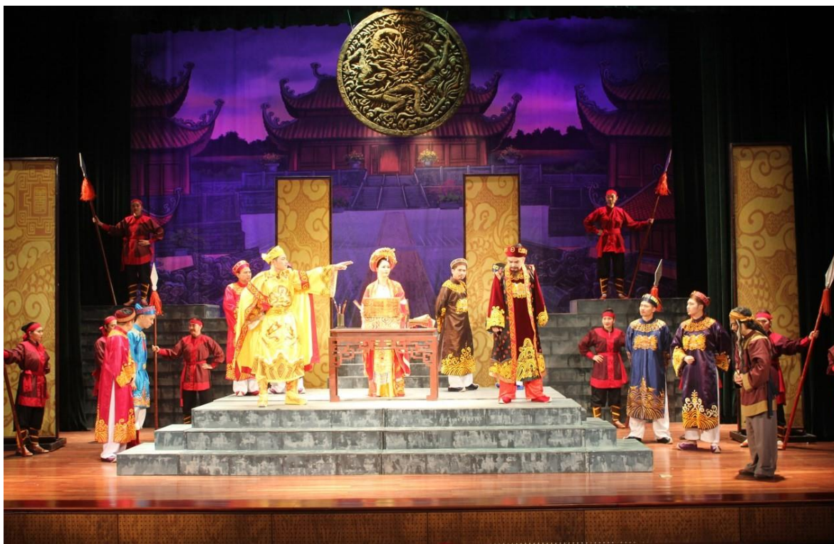
Ảnh 22: Cảnh trong vở Mặt chỉ giữa hoàng cung . Huy chương vàng Liên hoan nghệ thuật Chèo toàn quốc năm 2022.