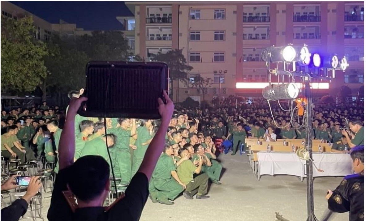
Ảnh 18: Cán bộ, giảng viên, học viên Học viện Quân y đón xem chương trình biểu diễn của Nhà hát Chèo Quân đội, năm 2024.