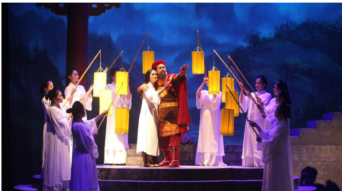
Ảnh 21: Cảnh trong vở Tình sử ngàn năm . Tham gia Liên hoan nghệ thuật Chèo toàn quốc năm 2022.