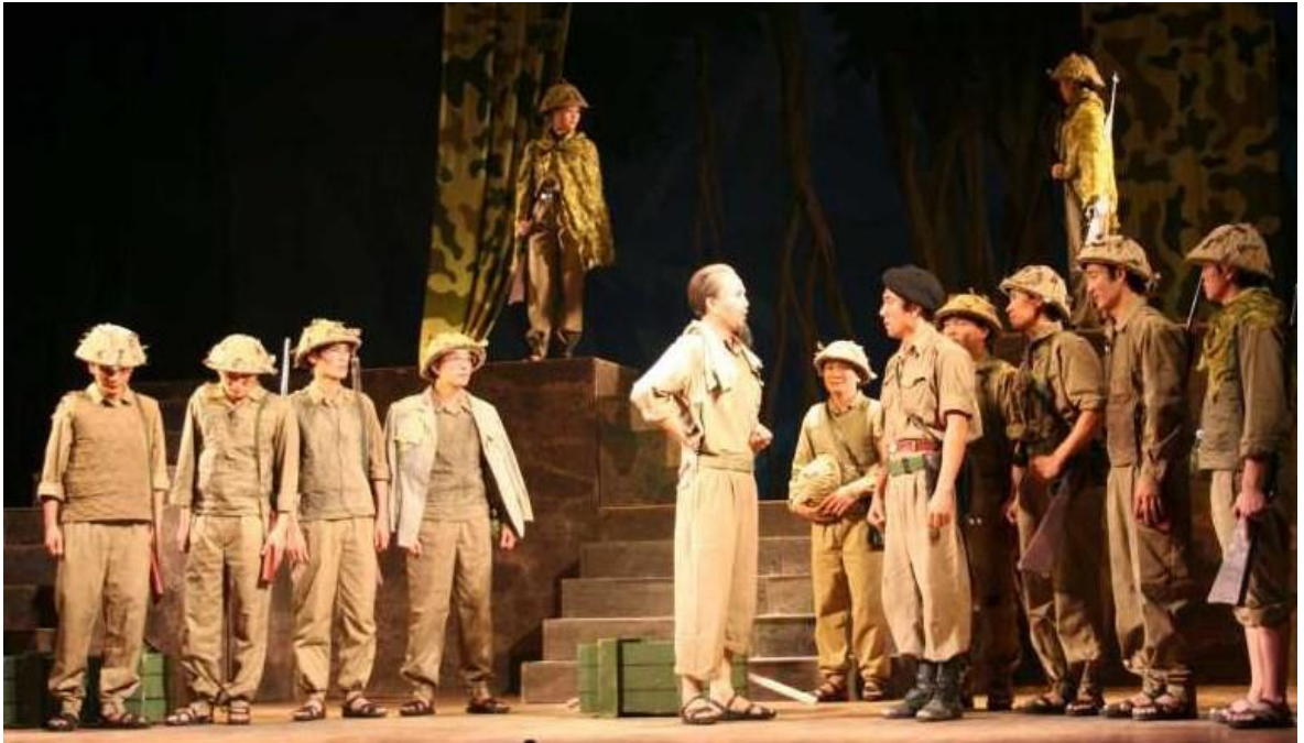
Ảnh 03: Cảnh trong vở Điều động lại sau chiến tranh . Giải A giải thưởng BQP về đề tài LLVT và chiến tranh cách mạng; Giải A giải thưởng Hội NSSK Việt Nam năm 1997