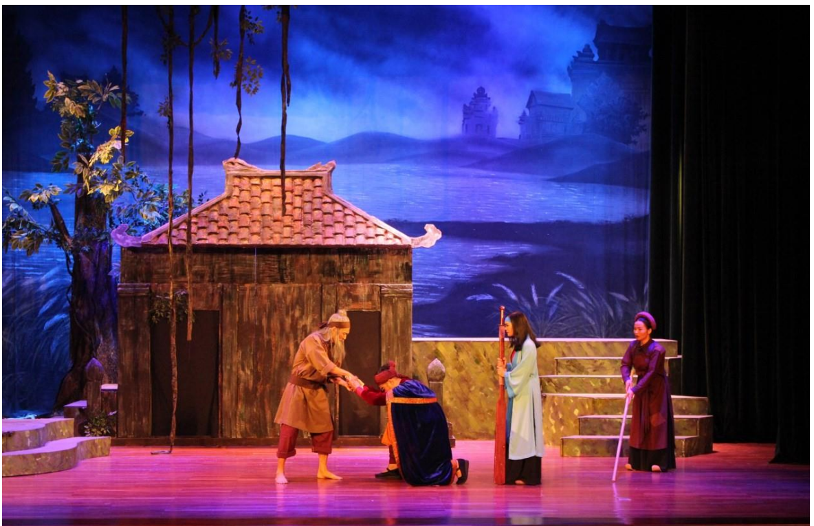
Ảnh 14: Cảnh trong vở Bến nước Ngũ Bồ . Tham gia Liên hoan nghệ thuật Chèo toàn quốc năm 2019.