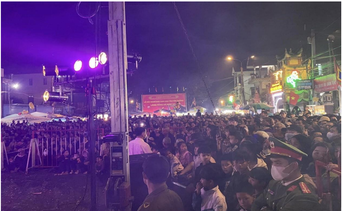
Ảnh 20: Cán bộ và nhân dân làng Tống Xá, thị trấn Lâm, huyện Ý Yên, tỉnh Nam Định đón xem chương trình biểu diễn của Nhà hát Chèo Quân đội, năm 2024.