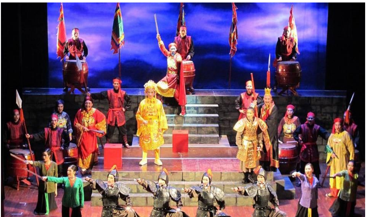
Ảnh 10: Cảnh trong vở Đời lượn anh hùng . HCV Cuộc thi Nghệ thuật Chèo chuyên nghiệp toàn quốc năm 2016.