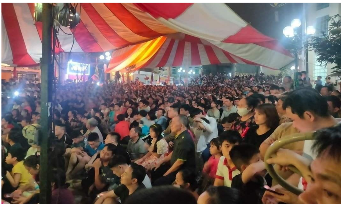
Ảnh 11: Cán bộ và nhân dân Khu phố Trang Liệt, phường Trang Hạ, Tp. Từ Sơn, tỉnh Bắc Ninh đón xem chương trình biểu diễn của Nhà hát Chèo Quân đội, năm 2022.