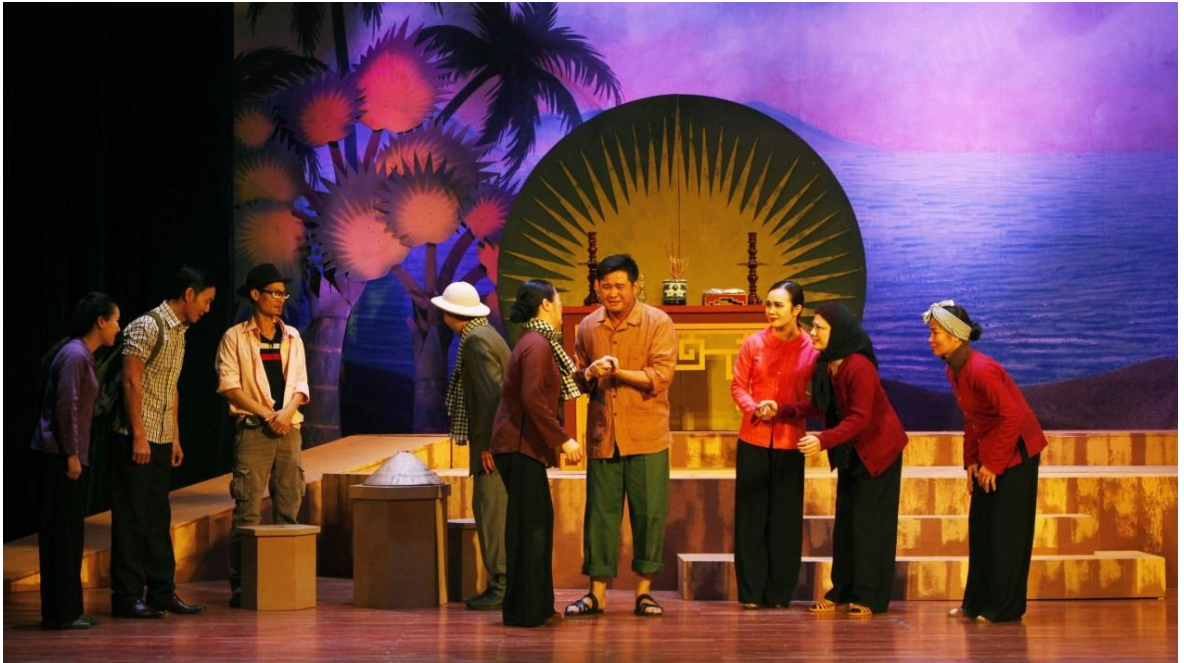
Ảnh 13: Cảnh trong vở Những người mẹ . HCV Hội diễn Nghệ thuật chuyên nghiệp toàn quân năm 2018.