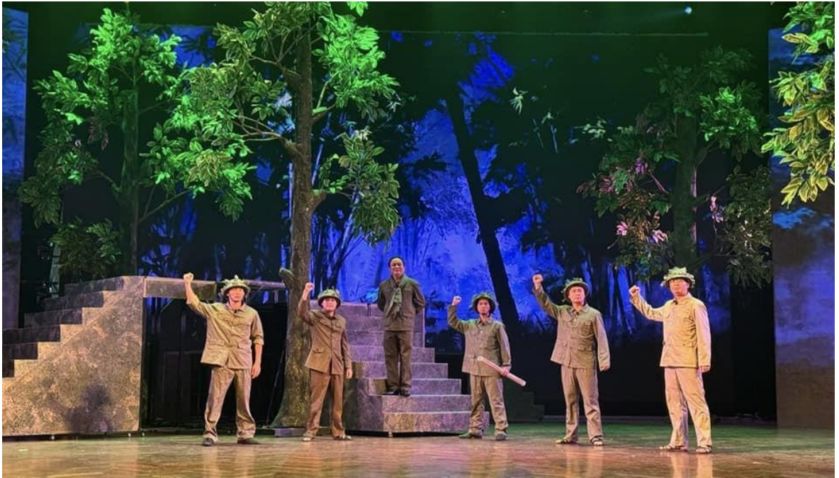
Ảnh 25: Cảnh trong vở Đại tướng Võ Nguyên Giáp. Huy chương Vàng Liên hoan sân khấu Hà Nội mở rộng năm 2024.