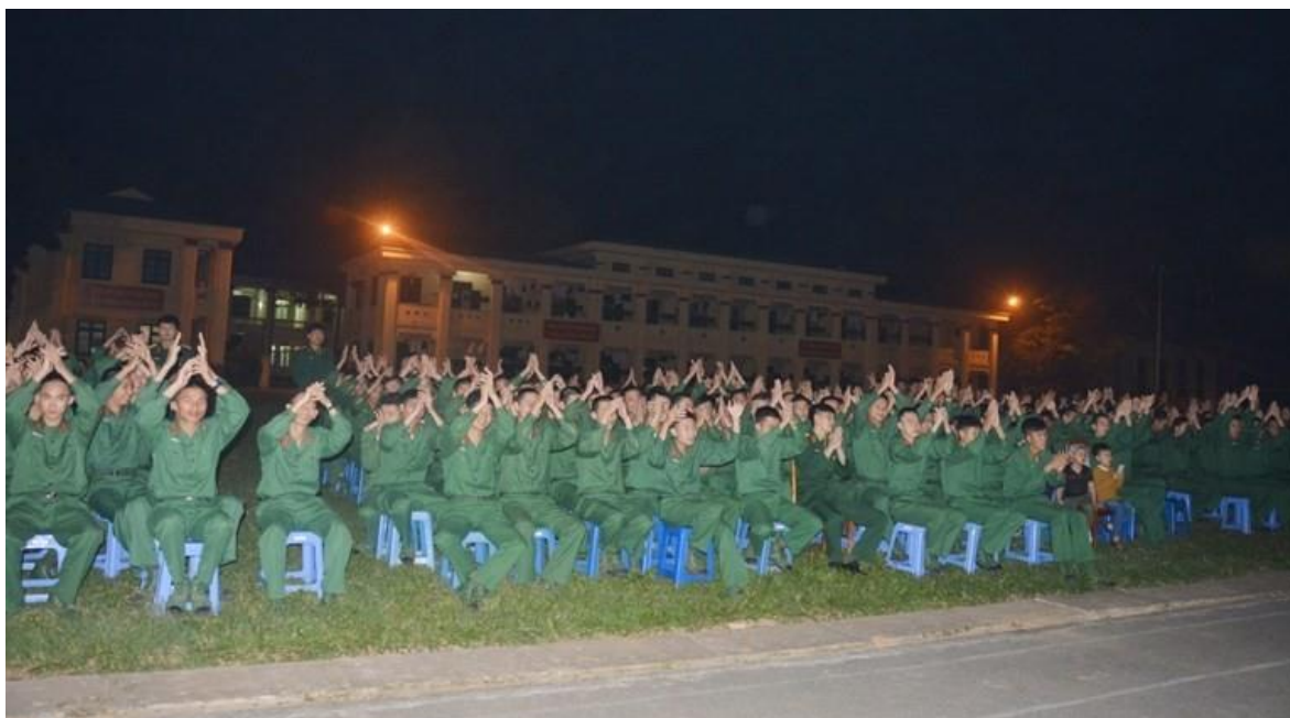
Ảnh 01: Cán bộ, chiến sĩ Đoàn 285, Bộ Tư lệnh Bảo vệ Lăng chủ tịch Hồ Chí Minh đón xem chương trình biểu diễn của Nhà hát Chèo Quân đội, năm 2017.