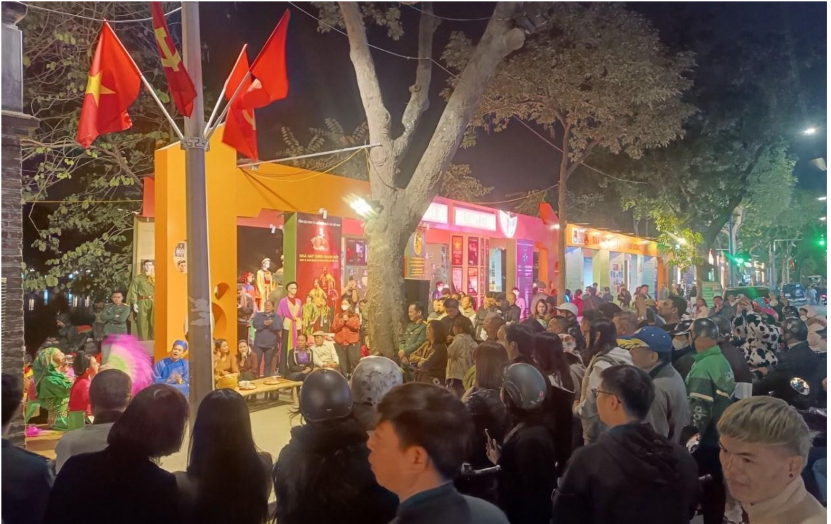
Ảnh 17: Du khách xem chương trình biểu diễn của Nhà hát Chèo Quân đội tại Triển lãm 80 năm thành lập Văn hóa Nghệ thuật Quân đội, năm 2024.