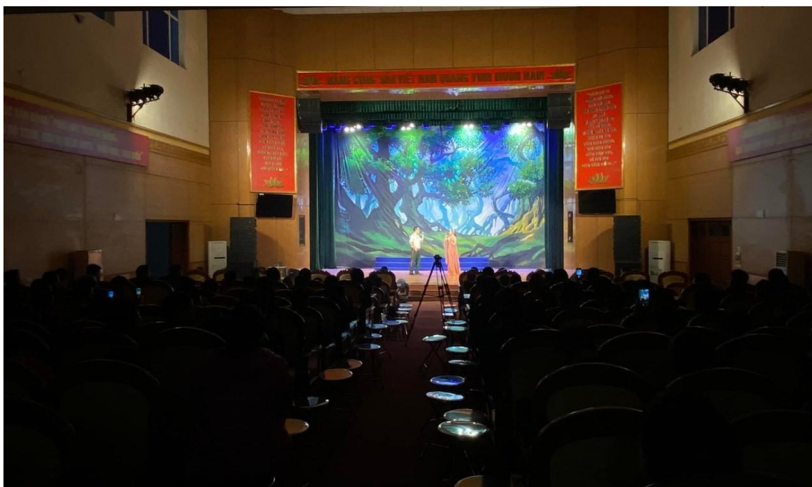
Ảnh 05: Cán bộ, chiến sĩ Trung tâm Bồi dưỡng nghiệp vụ, Bộ Tư lệnh Cảnh sát biển Việt Nam, đón xem chương trình biểu diễn của Nhà hát Chèo Quân đội, năm 2020.