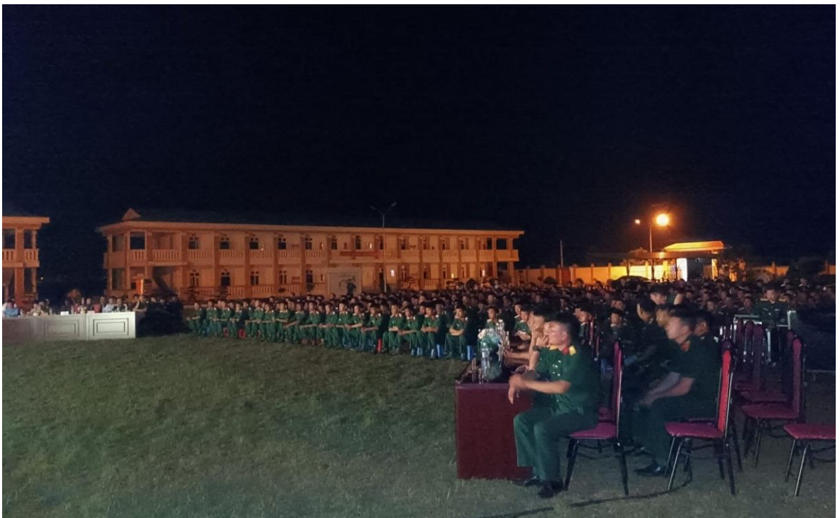
Ảnh 16: Cán bộ và chiến sĩ Ban chỉ huy quân sự huyện Mộc Châu, tỉnh Sơn La đón xem chương trình biểu diễn của Nhà hát Chèo Quân đội, năm 2024.