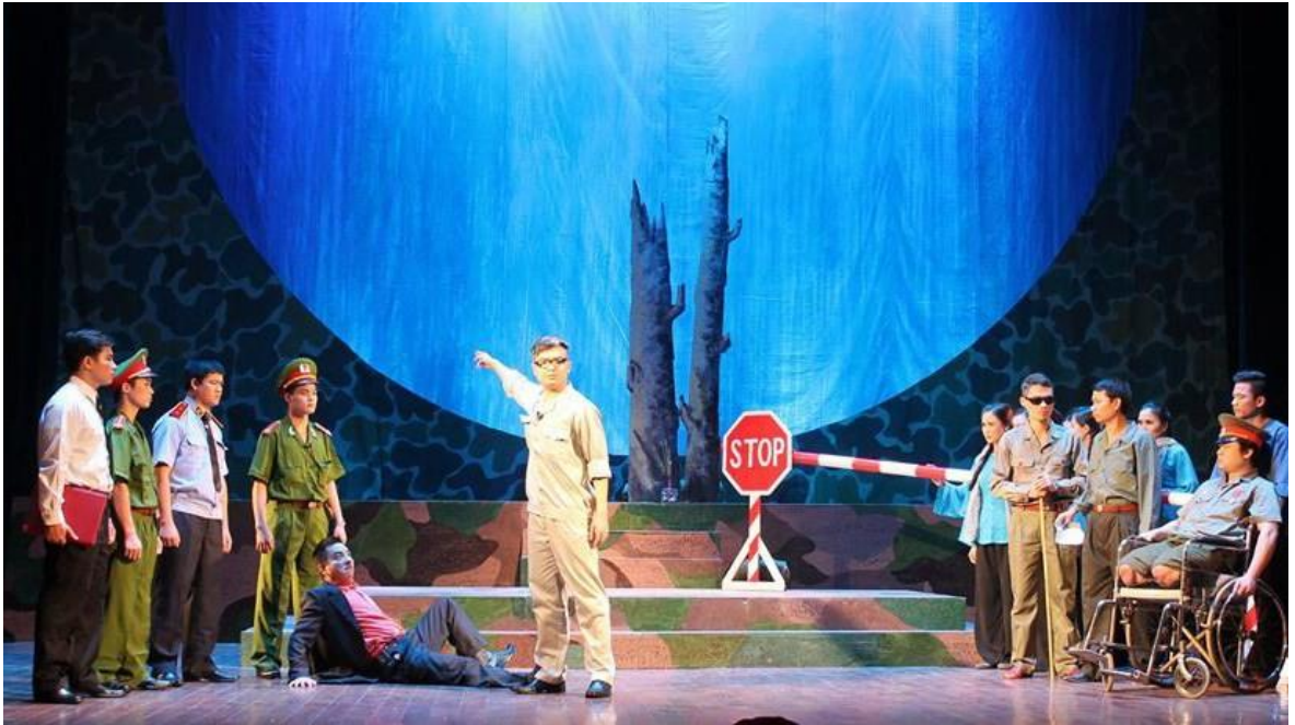
Ảnh 09: Cảnh trong vở Người chiến sĩ năm xưa . HCV Liên hoan sân khấu toàn quốc về “Hình tượng người chiến sĩ Công an nhân dân” lần thứ III năm 2015.