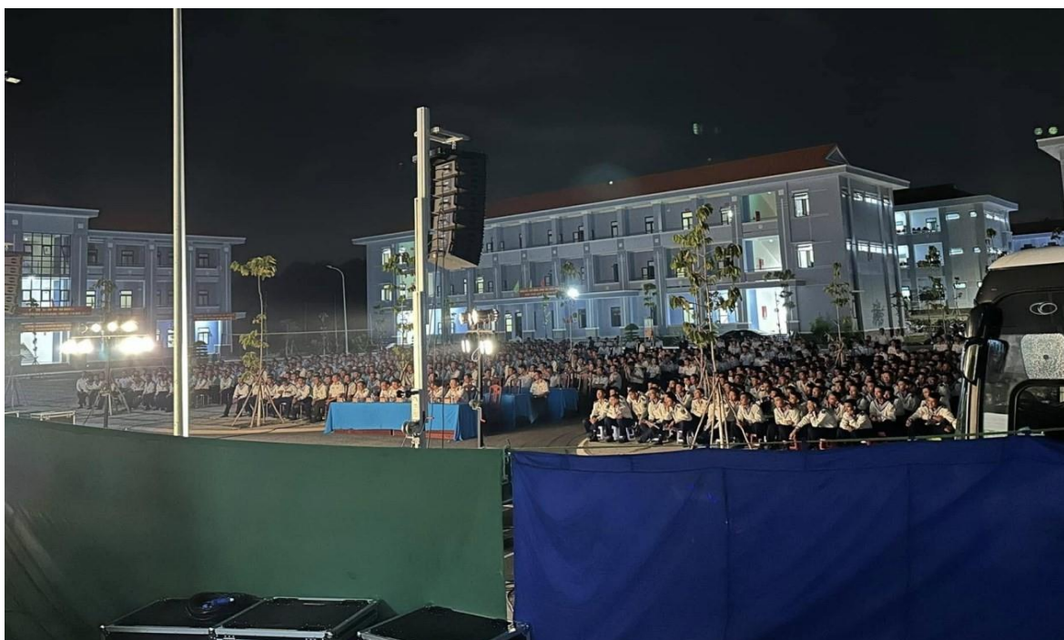
Ảnh 02: Cán bộ, chiến sĩ Bộ Tư lệnh Vùng 4, Quân chủng Hải Quân đón xem chương trình biểu diễn của Nhà hát Chèo Quân đội năm 2017.