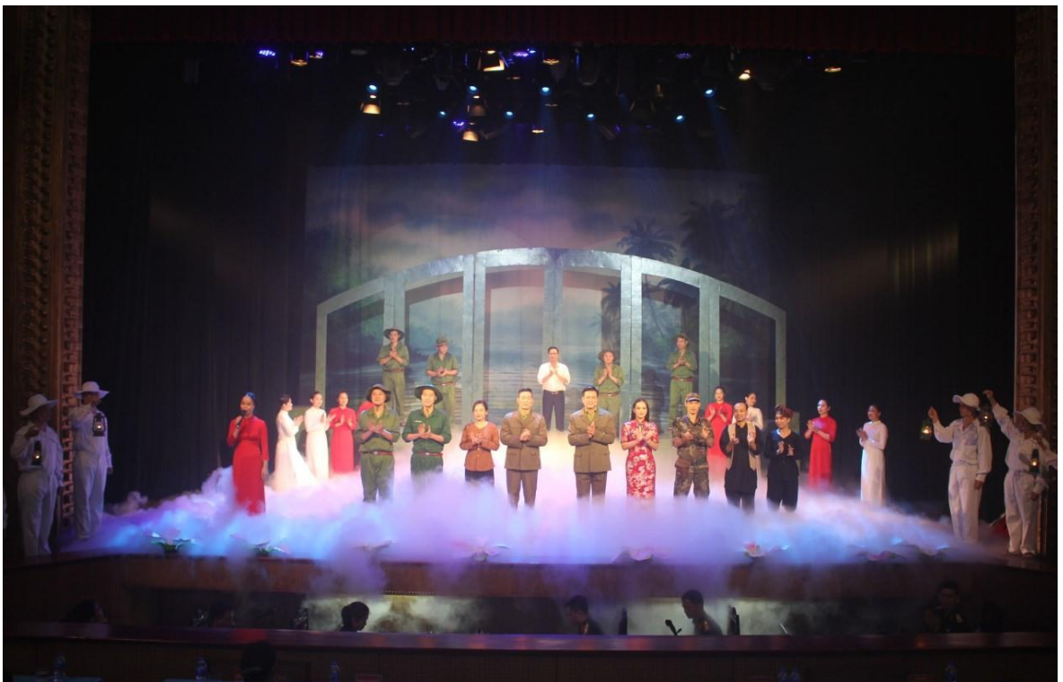
Ảnh 26: Cảnh trong vở Dòng sông kể chuyện . Công trình chào mừng kỷ niệm 80 năm ngày thành lập Quân đội nhân dân Việt Nam.