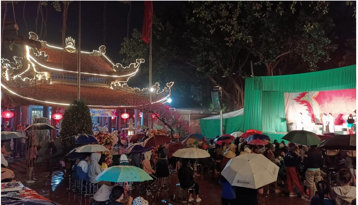
Ảnh 03: Cán bộ và nhân dân Khu phố Kim Thiều, Phường Hương Mạc, Tp. Từ Sơn, tỉnh Bắc Ninh đón xem chương trình biểu diễn của Nhà hát Chèo Quân đội, năm 2018.