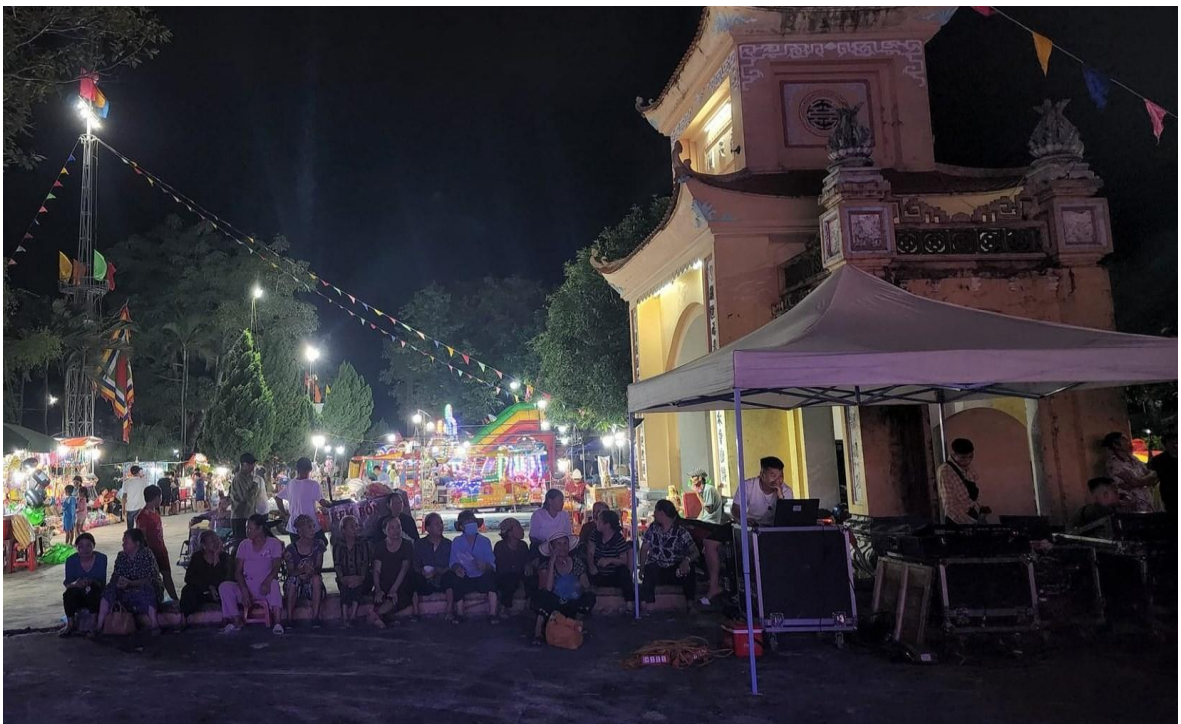
Ảnh 08: Cán bộ và nhân dân xã Xuân Thủy, huyện Xuân Trường, tỉnh Nam Định, đón xem chương trình biểu diễn của Nhà hát Chèo Quân đội, năm 2022.