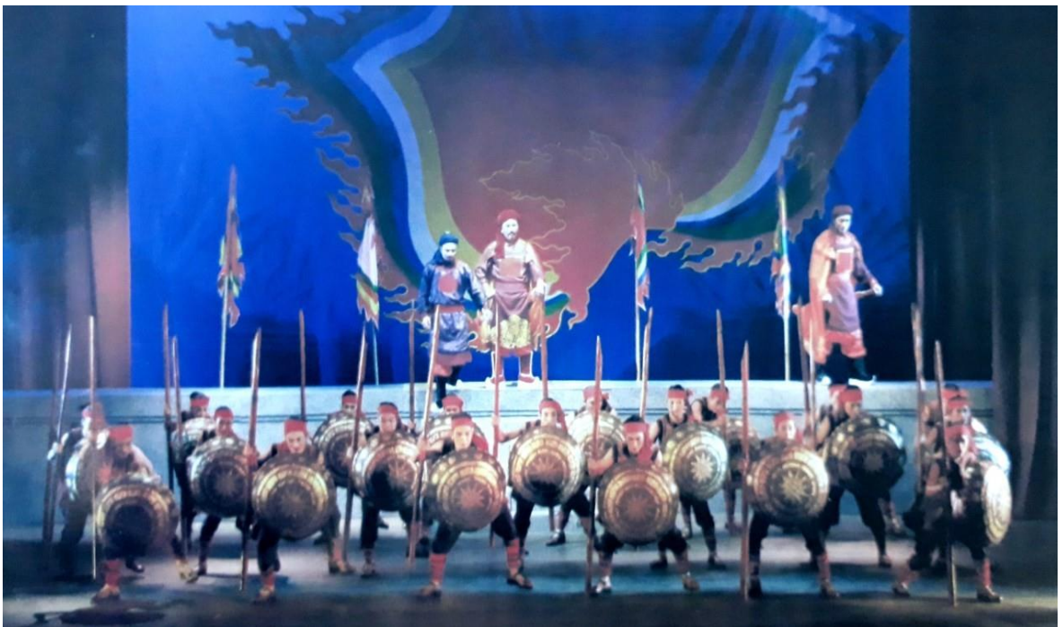
Ảnh 04: Cảnh trong vở Hùng ca Bạch Đằng giang . HCB Hội diễn Nghệ thuật chuyên nghiệp toàn quốc năm 2009.