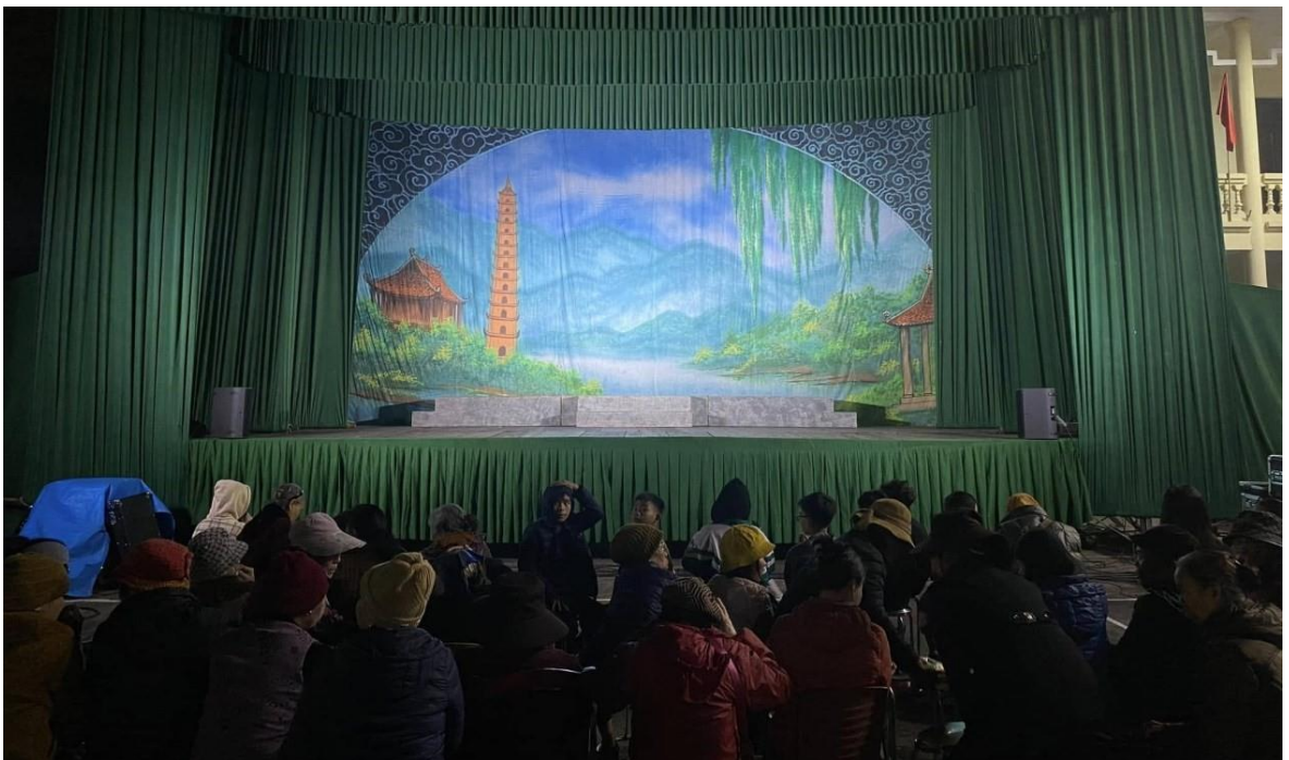
Ảnh 26: Cán bộ và nhân dân phường Kim Bảng, thành phố Từ Sơn, tỉnh Bắc Ninh đón xem chương trình biểu diễn của Nhà hát Chèo Quân đội, năm 2024.