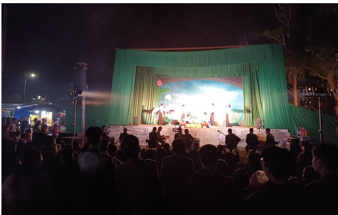
Ảnh 12: Cán bộ và nhân dân thôn Bất Phí, xã Yên Hòa, huyện Quế Võ, tỉnh Bắc Ninh đón xem chương trình biểu diễn của Nhà hát Chèo Quân đội, năm 2023. (Nguồn ảnh: Phạm Huy Quang)