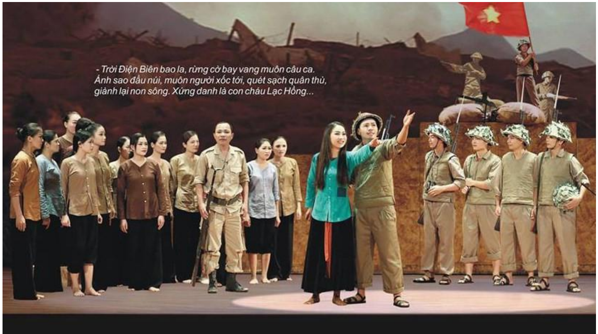
Ảnh 11: Cảnh trong vở Ánh sao đầu núi . Đạt giải Vở diễn xuất sắc nhất tại Cuộc thi Nghệ thuật Chèo chuyên nghiệp toàn quốc năm 2016.