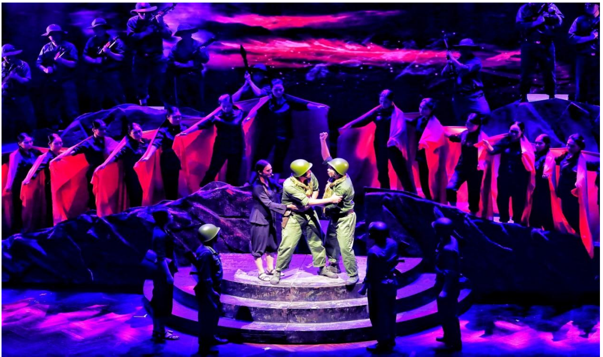
Ảnh 24: Cảnh trong vở Đại đội trưởng của tôi . Huy chương Bạc Hội diễn nghệ thuật chuyên nghiệp về đề tài quốc phòng toàn dân năm 2023.