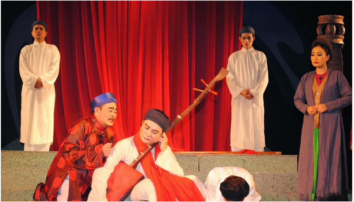
Ảnh 07: Cảnh trong vở Tiếng đàn vùng mê thảo . Vở diễn xuất sắc nhất tại Hội diễn sân khấu Chèo chuyên nghiệp toàn quốc năm 2013.