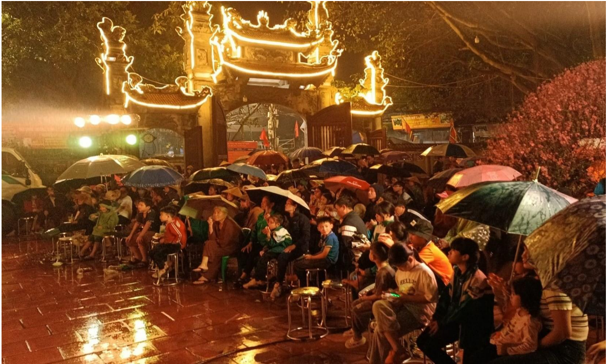
Ảnh 19: Cán bộ và nhân dân Khu phố Kim Thiều, phường Hương Mạc, Tp. Từ Sơn, tỉnh Bắc Ninh đón xem chương trình biểu diễn của Nhà hát Chèo Quân đội, năm 2024.